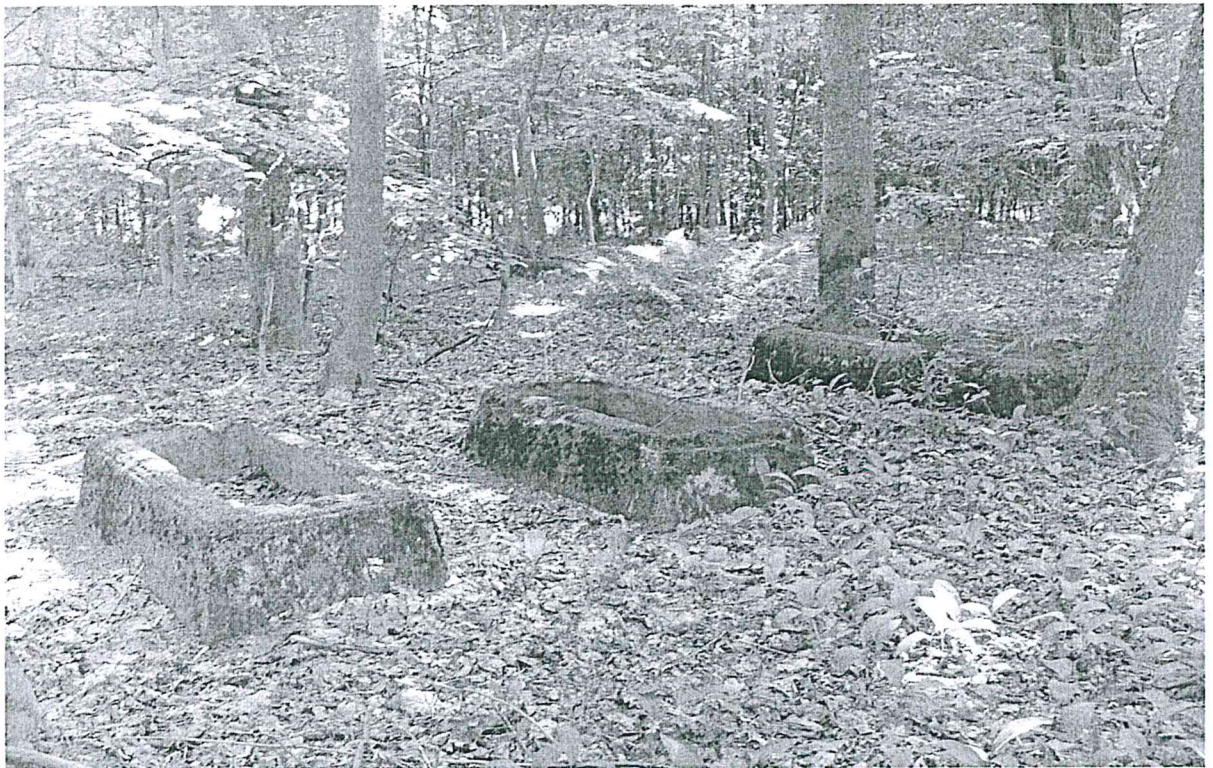
Rysunek 2. Pozostałości cmentarza w miejscowości Barty.